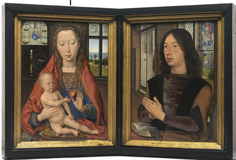
Hans Memling, Diptiek van Maarten van Nieuwenhove, 1487, olieverf op paneel Brugge, Musea Brugge, O.SJ0178.I