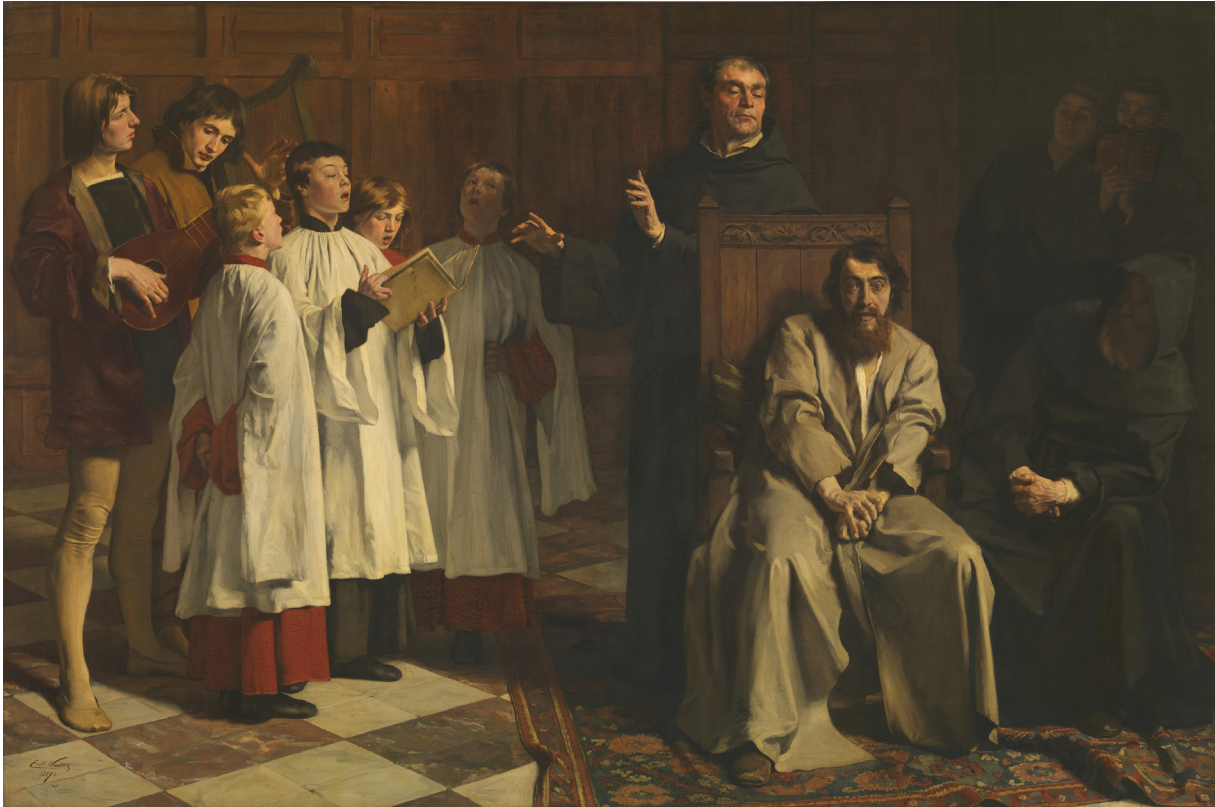
Emile Wauters, Hugo van der Goes in het Rode Klooster, 1872, olieverf op doek Brussel, Koninklijke Musea voor Schone Kunsten van België, 2519

De kroniek, die in 1863 – tijdens het hoogtepunt van de romantiek - werd teruggevonden, had een grote invloed op de beeldvorming van de kunstenaar Hugo van der Goes en de interpretatie van zijn werken. Kunsthistorici en historici zijn het er al een hele tijd over eens dat de interpretatie van Van der Goes als kunstenaar met een getormenteerde geest foutief is. Toch blijft deze mythe overeind. De introductie van de tentoonstelling belicht deze geschiedschrijving rond de persoon en het oeuvre van Van der Goes.