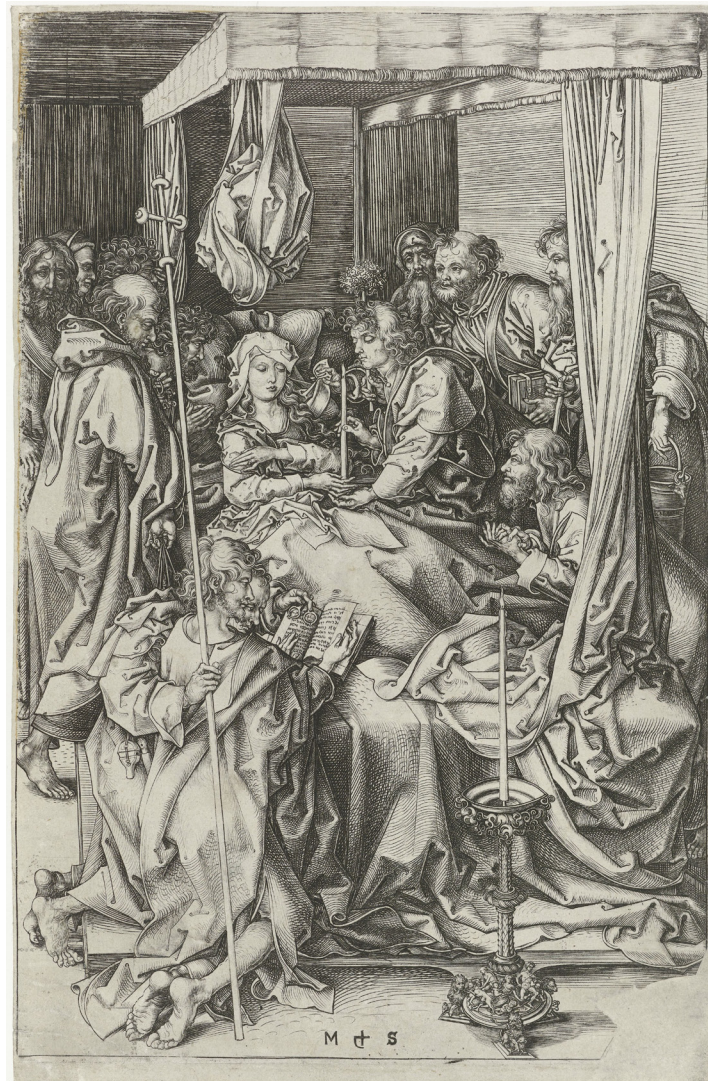
Martin Schongauer, Sterfbed van Maria, circa 1470-1491, gravure op papier Amsterdam, Rijksmuseum, RP-P-OB-1022

De apostelen verzamelen zich rond het bed maar gaan niet volledig op in hun eigen emoties. In kleine groepjes vervullen ze de rol van aanwezigen rond het sterfbed. In de 'De dood van Maria' heeft Van der Goes een belangrijke stap gezet. In deze context moet de prent van Martin Schongauer, 'Sterfbed van Maria', jaren 1470, worden vermeld. Sommige auteurs beschouwen Hugo van der Goes als de eerste die een dergelijke compositie maakte, anderen beschouwen Schongauer als inventor.