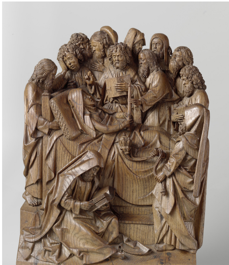
Adriaen van Wesel, Het Sterfbed van Maria, fragment van het Maria-altaar van de Onze-Lieve-Vrouwebroederschap te Den Bosch, circa 1475-1477, eik Amsterdam, Rijksmuseum, BK-NM-11859

De dood van Maria inspireerde niet alleen kunstenaars. Het onderwerp speelde een belangrijke rol in het christelijke geloof. Iedere stap in het leven van Onze-Lieve-Vrouw kreeg de volle aandacht. Dat geldt ook voor de manier waarop de Heilige Maagd met haar dood omging. In de apocriefe verhalen over Maria's dood is de angst voor de dood afwezig. De nadruk ligt vooral op sterven als verlossing en de hoop op een hemelse toekomst in aanwezigheid van God. Het laat vijftiende-eeuwse retabelfragment van het Maria-altaar van de Onze-Lieve-Vrouwebroederschap van Den Bosch uit het Rijksmuseum, Amsterdam, is een van de meest uitmuntende voorbeelden van de wijze waarop elementen van het Mariaverhaal uit de 'Legenda Aurea' visueel werden vertolkt en fungeert dan ook als driver in de tentoonstelling.