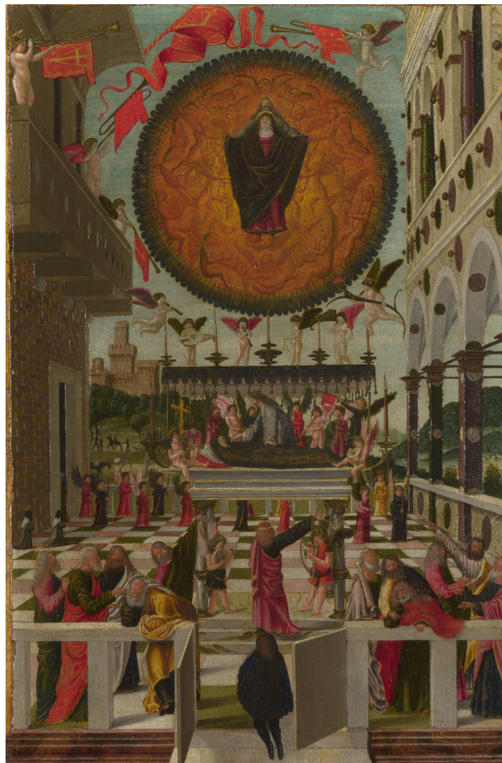
Gerolamo da Vicenza, Het sterfbed en de tenhemelopneming van Maria, 1488, tempera op paneel Londen, The National Gallery, NG3077

De vijftiende-eeuwse mens was op verschillende manieren vertrouwd met de religieuze verhalen, en dus ook met het sterfbed van Maria. Via de liturgie en de mis, maar ook via processies, toneel en beeldende kunsten, zoals schilderijen, prenten en sculpturen. Een interessant voorbeeld hiervan zijn de zeven Bliscappen van Maria, een cyclus van zeven mysteriespelen, waarvan er tussen 1448 en 1566 jaarlijks één werd opgevoerd na afloop van de Ommegang in Brussel. 'Die sevenste Bliscap onser vrouwen' gaat over de laatste dagen van Maria op aarde, haar dood en haar hemelvaart. In deze invalshoek plaatst het wetenschappelijke kernteam een schilderij als 'De dood van Maria' binnen deze bredere beeldcultuur.