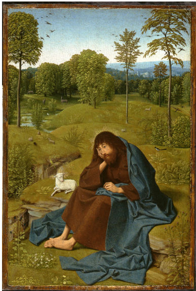
Geertgen tot Sint Jans, Johannes in de wildernis, circa 1480-1490, olieverf op paneel Berlijn, Gemäldegalerie, Staatliche Museen zu Berlin, 1631

Het lijdt bovendien geen twijfel dat er van 'De dood van Maria' een spirituele kracht uitgaat. Het schilderij nodigt uit tot contemplatie, tot innerlijke beschouwing. Onbetwiste drivers in deze invalshoek zijn de topwerken 'Johannes in de wildernis' van Geertgen tot Sint-Jans (Berlijn, Staatliche Museen, Gemäldegalerie) en 'Van Nieuwenhove-diptiek' van Hans Memling (Musea Brugge).